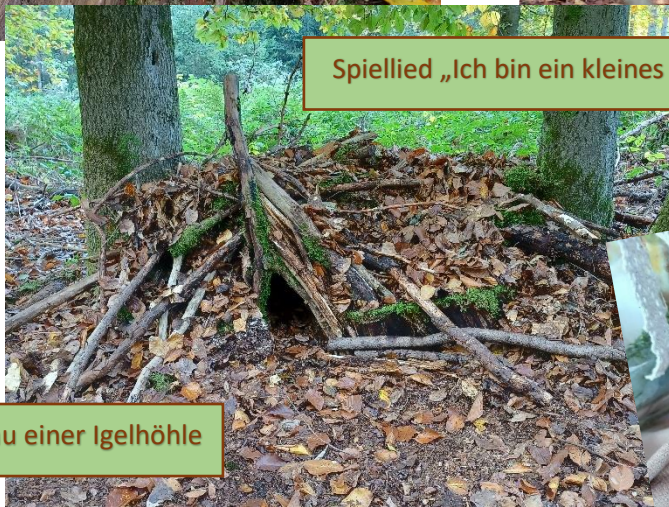
Spiellied „Ich bin ein kleines Igelkind“