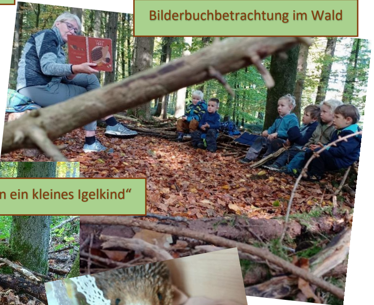
Bilderbuchbetrachtung im Wald