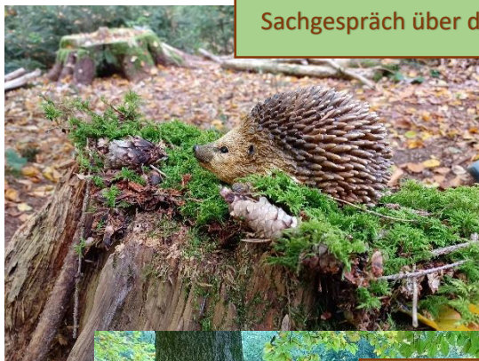
Sachgespräch über den Igel