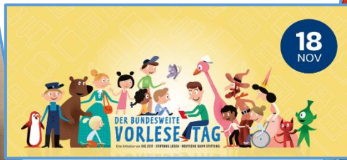
Unsere Lesepatin Frau Aubele zu Besuch im Waldwagen in Kooperation mit der Bibliothek „Im Kronenhof“