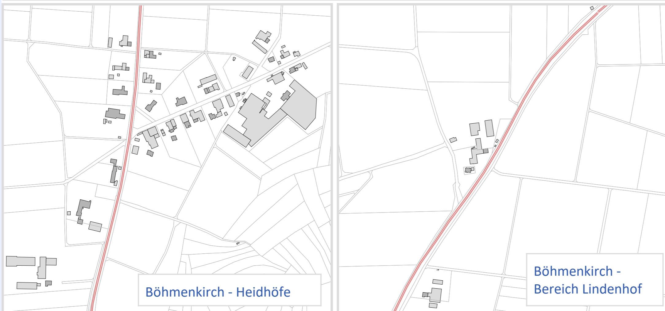
Böhmenkirch - Heidhöfe