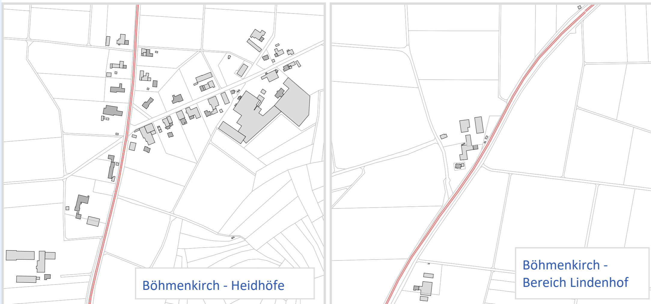
Böhmenkirch - Heidhöfe