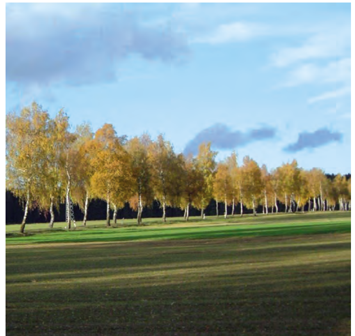
So schön sah die Birkenallee einmal aus