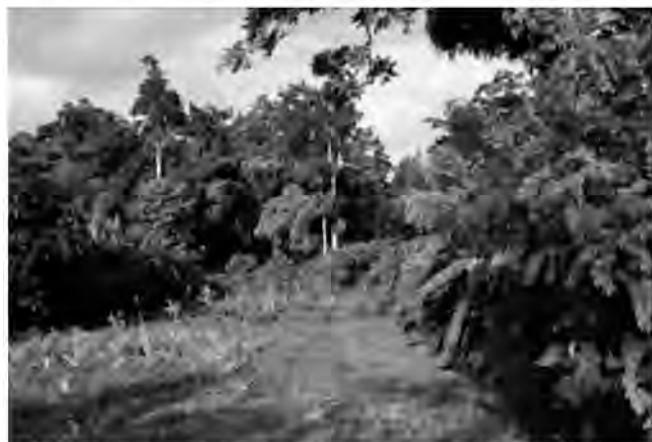
Waldrand in Vanuatu