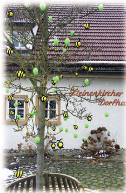
Osteraktion der Landfrauen Steinenkirch