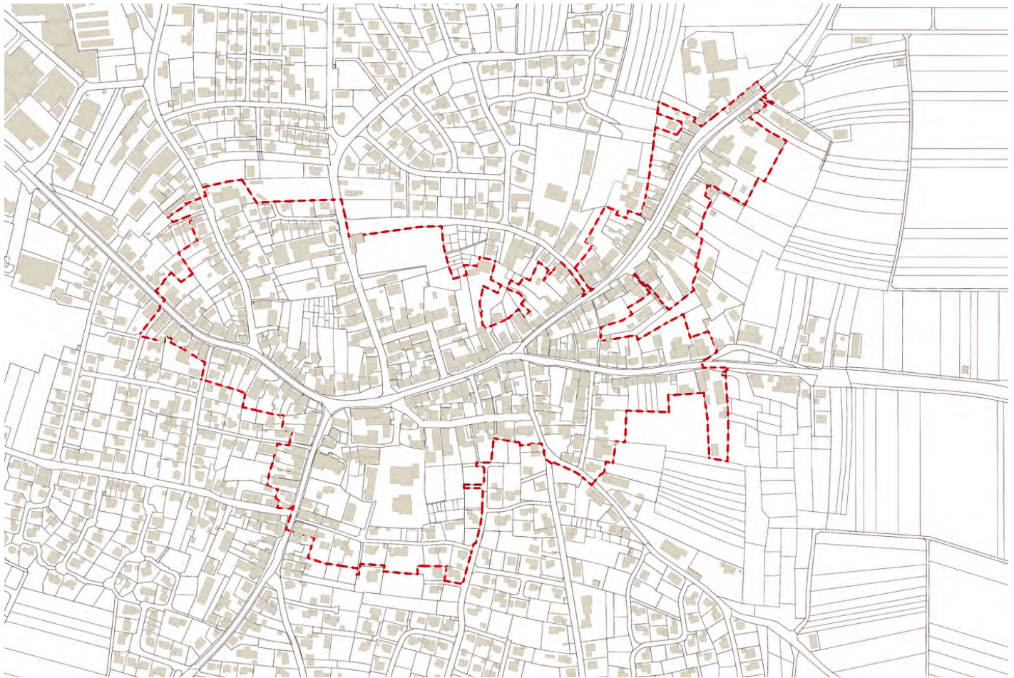
Abbildung 1: Abgrenzung des Untersuchungsgebiets

Nach der Bestandsaufnahme und Bestandsanalyse und den Hinweisen und Bewertungen aus der repräsentativen Bürgerbefragung und der Klausurtagung mit dem Gemeinderat wurde das Handlungsfeld Mobilität | Verkehr und Wohnen | Bebauung von allen Beteiligten als Bereich mit dem größten Bedarf in den kommenden Jahren identifiziert.