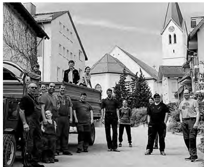
Die fleißigen Helfer.