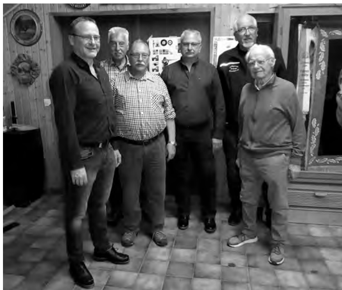
Anwesender Teil der geehrten Vereinsmitglieder

Leider konnten nicht alle Geehrten anwesend sein.