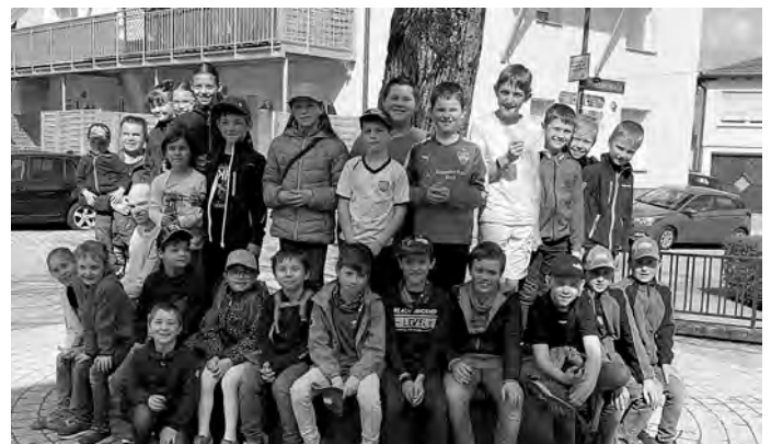
Kinderkreuzweg in Schnittlingen