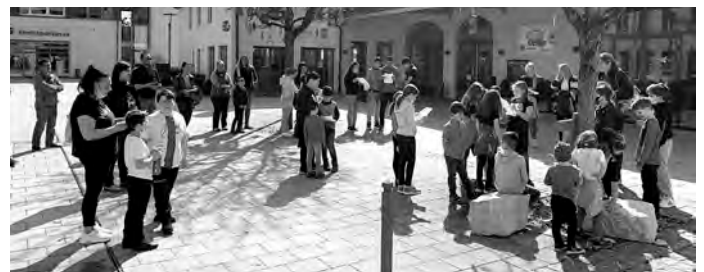
Kinderkreuzweg in Böhmenkirch

Vielen Dank an die Organisatorinnen der beiden Kinderkreuzwege in Böhmenkirch und Schnittlingen für die liebevolle Gestaltung!