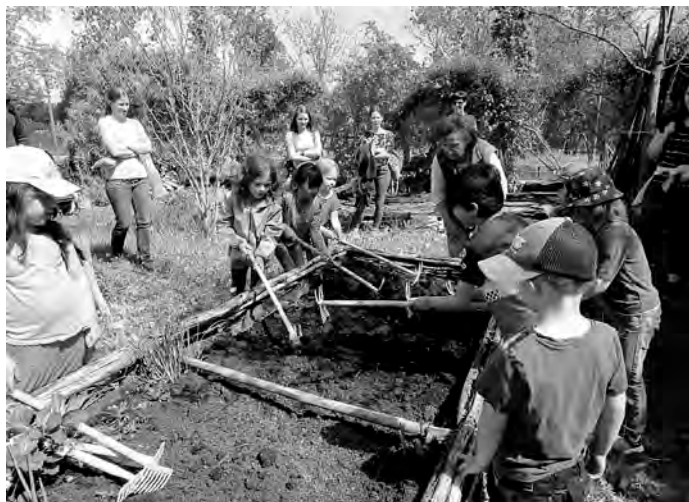
Wir bereiten das Hochbeet vor