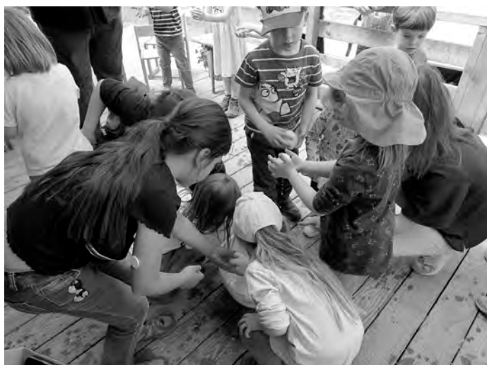
Beim Schnecken basteln

Einen rundum schönen Familientag bei schönem Wetter erlebten unsere Eltern mit ihren Kindern am vergangenen Freitag. Die Familien wurden in drei erlebnispädagogische Themengruppen aufgeteilt Gewässer - Garten - Schnecken