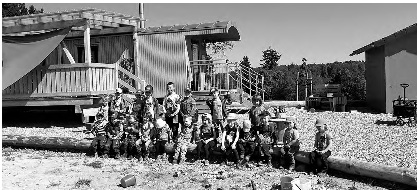
Kindergarten St. Johannes zu Besuch beim Naturkindergarten

Unser Spendenkässchen steht an diesen Tagen auch bereit, über Spenden freut sich's jederzeit!