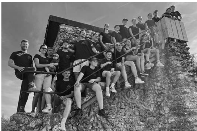
Auf der „Villa Maus“