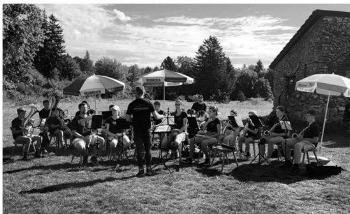
Auftritt am Franz-Keller-Haus