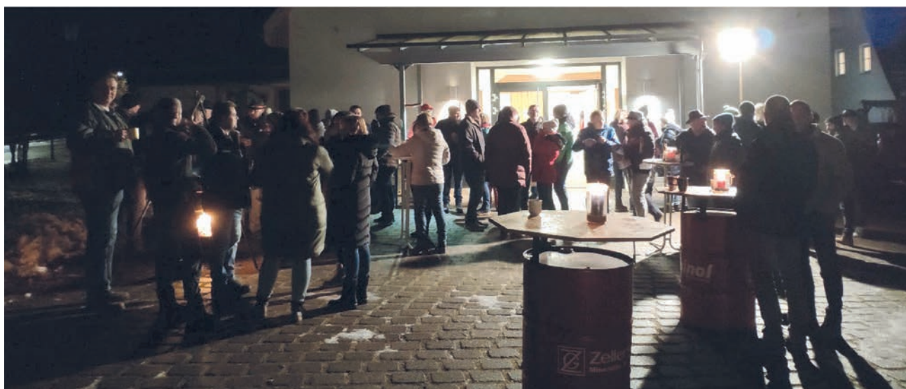
750 Jahre Steinenkirch - Met und Glühwein im Mondschein, Steinenkirch