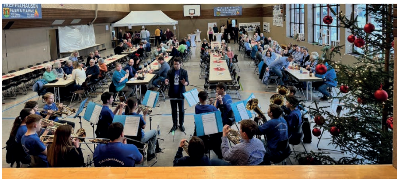
750 Jahre Treffelhausen - Feierliche Festmatinée zum Ortsjubiläum