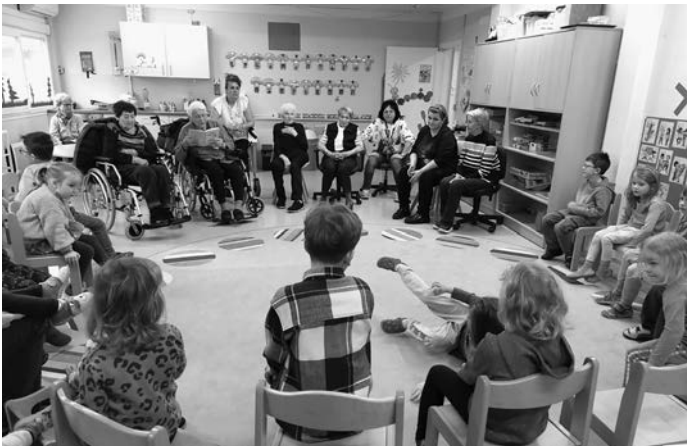
Grüße - das Kindergartenteam

Am Montag ging es gleich weiter mit unserer Kooperation Seniorenheim Avendi. Dieses Mal kamen wieder die Senioren in den Kindergarten und besuchten die Krippen und -Kindergartenkinder. Sie lasen ein Buch vor und spielten mit den Kindern. Danach sangen wir noch unser Schneemannlied vor. Eine Bereicherung für Groß und Klein.