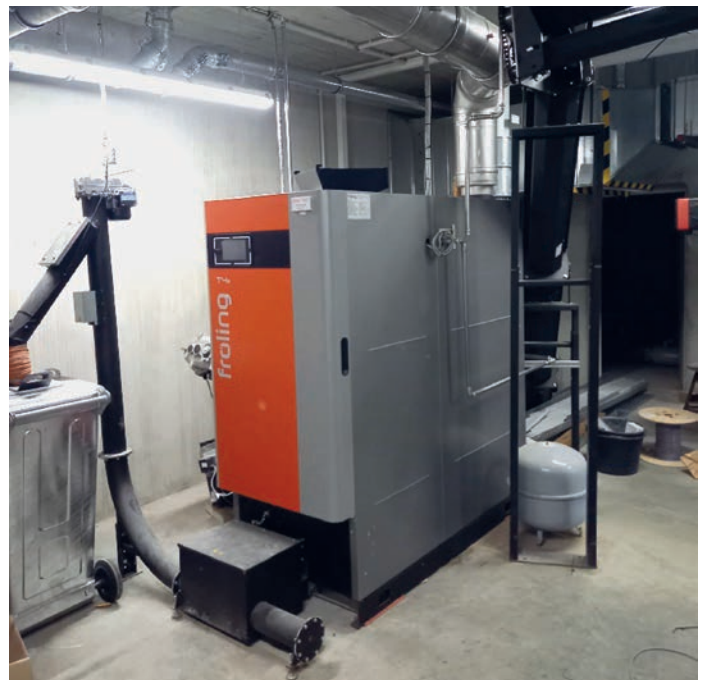
Blick in die neue Heizzentrale

Die Arbeiten zur Errichtung der neuen Heizzentrale am Schulzentrum stehen kurz vor der Fertigstellung. In den vergangenen Monaten konnte das neue Technikgebäude errichtet und der neue Hackschnitzelkessel eingebaut werden, der die alte Ölheizung im Schulzentrum ersetzt. Ebenso konnte das Gebäudenetz (Wärmenetz) baulich erweitert und die Gebäude Blumenstraße 16, Kirchstraße 1 und Parkstraße 1 an die erweiterte Heizzentrale angebunden werden. Dadurch wurde es auch in diesen Gebäuden möglich, die alten Heizungsanlagen, die durchgängig noch mit fossilen Energieträgern betrieben wurden, zu ersetzen. Wir sind froh, dieses richtungsweisende Projekt dank finanzieller Unterstützung durch den Bund umsetzen zu können. Nach finaler Fertigstellung ist ein Tag der offenen Tür zur Besichtigung der Anlagen geplant.