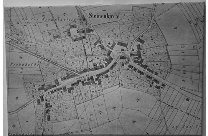
Ausschnitt der Tafel mit Lageplan, zum Eintragen der Hausnamen etc.

Es war eine Freude zu sehen, wie herzlich sich Jung und Alt begrüßten. Darunter waren auch einige Gäste, die aus Steinenkirch stammen, mittlerweile außerhalb wohnen. Nach einer ersten Kaffee- und Kuchenrunde gings dann auch schon los.