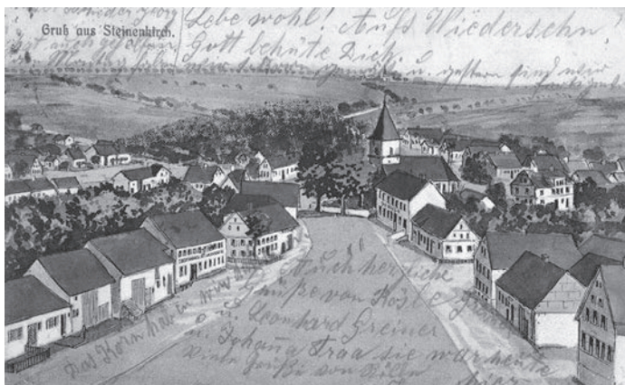
Karte von HG Schmid