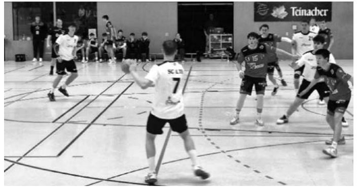
Die Spieler der SG LTB hatten in der zweiten Hälfte alles im Griff.

SG LTB: Hick, Strahberger, Lenz (10), Lang (7), Pfeffer (5), Merkle (5), Eberhardt (5), Sailer (4), Geiger (2), Griesser, Ziller, Kriz, Wollinger, Klingler.