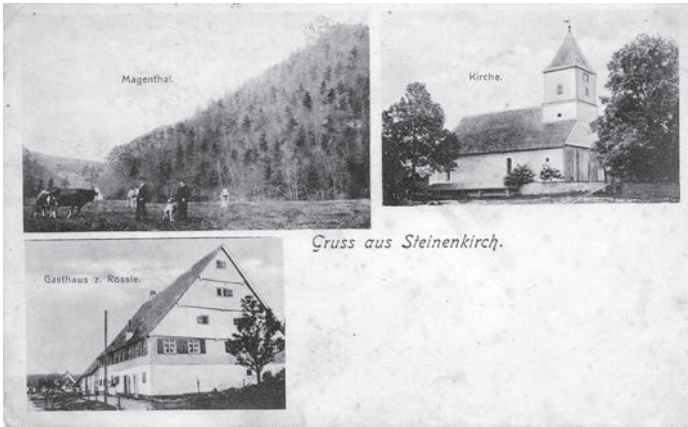
Postkarte um 1900 „Gruss aus Steinenkirch“

Musikalisch umrahmt wird der Abend vom Gemischtem Chor Steinenkirch . Beginnend mit einem zeitgenössischen Lied aus dem 12. Jahrhundert, wird es Chor-Lieder aus verschiedenen Epochen geben, bis hin zu Hits des 21. Jahrhunderts.