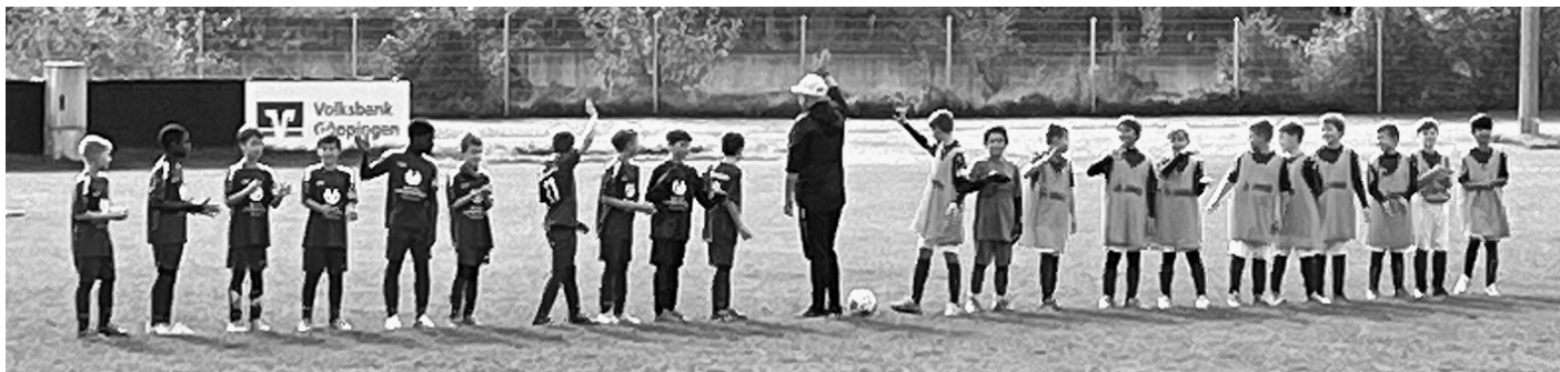
Unsere Jungs in Blau beim Einlaufen!

Hausen/Überkingen war sicherlich schlagbar, aber aufgrund unserer sehr behäbigen Leistung dann an diesem Tage doch eine Nummer zu groß für uns.