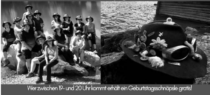
Wer zwischen 19- und 20 Uhr kommt erhält ein Geburtstagsschnäpsle gratis!