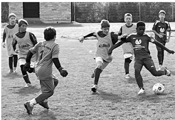
Großchance – aber wieder der Torhüter im Weg!

Von daher... gebt jetzt nochmal Gas, am kommenden Samstag steht dann auch schon unser letztes Heimspiel für dieses Jahr an!