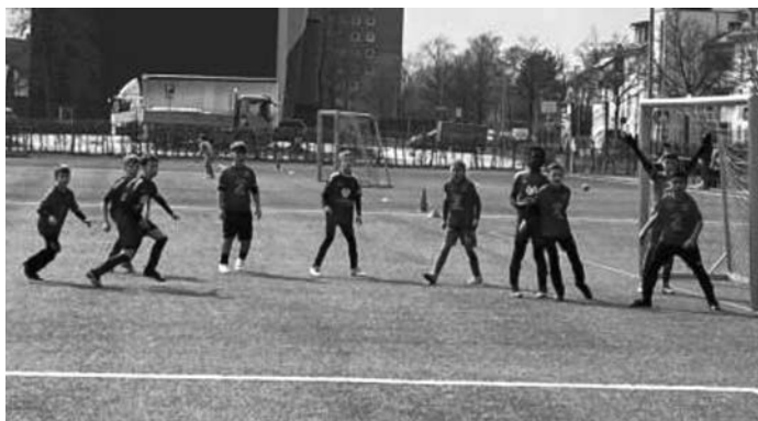
Vor dem Göppinger Kasten wird's wieder gefährlich!