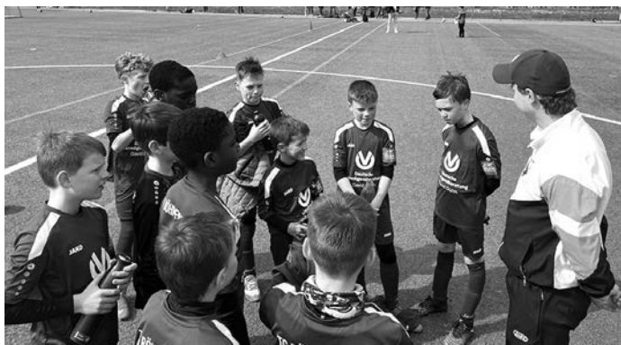
Trainerlob nach dem Spiel!