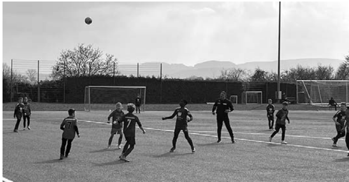
Ab geht's nach vorne!

Und hier noch die Bilder zum Sieg in Göppingen: