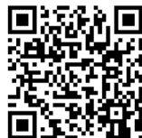
QR-Code Meine Umwelt-App

Die Landesanstalt für Bienenkunde der Universität Hohenheim prüft die eingehenden Meldungen und gibt bei Nestfunden den Meldenden weitere Instruktionen und unterstützt bei der Vermittlung von sachkundigen Personen für die Nestentfernung.