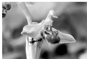
Bienenragwurz mit Ameise

Unsere Monatsversammlung findet am Donnerstag, 12. März um 20 Uhr im Gasthaus Traube, Donzdorf statt. Dr. Uwe Wacker hält einen Bildervortrag über heimische wilde Orchideen . Es werden Bilder von ca. 30 Arten heimischer Orchideen aus der näheren Umgebung gezeigt. Der ursprünglich geplante Vortrag über Hantaviren wird auf einen späteren Termin verschoben.