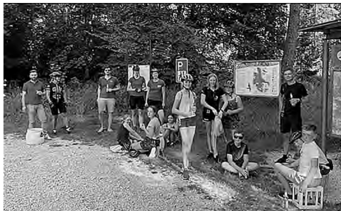
Überraschung und Abkühlung im Wental

Zum Abschluss vor den Sommerferien ließ es sich der Großteil der Jugend nicht nehmen und radelte trotz der hochsommerlichen Temperaturen gemeinsam ins Wental.