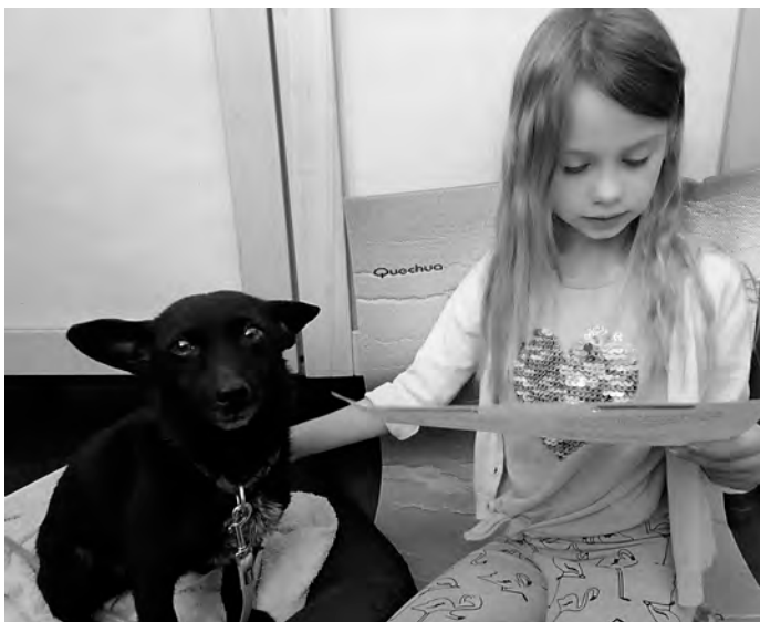
Wir lesen unserem Schulhund etwas vor