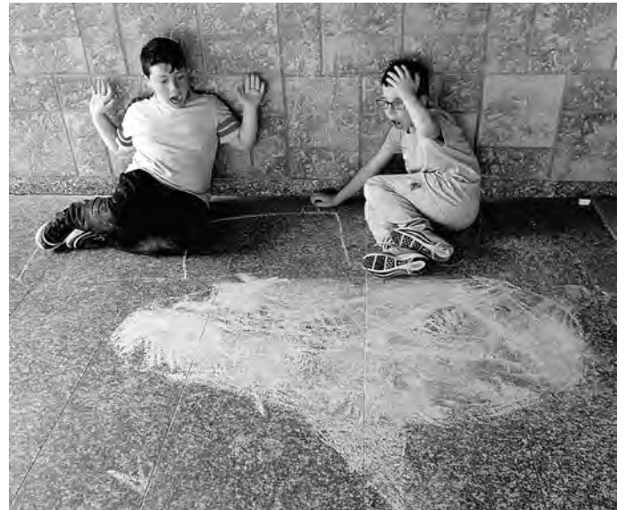
Straßenmalerei - Hai vor dem Boot