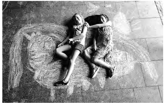
Straßenmalerei - Ritt auf dem Einhorn