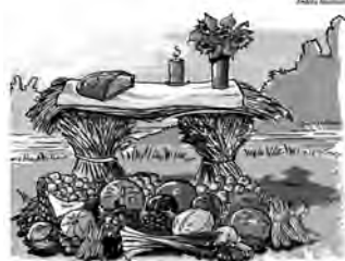
„Dankbarkeit macht das Leben erst reich.“ Wenn die Dankbarkeit öffnet die Augen dafür, dass „der Mensch unendlich mehr empfängt, als er gibt“ (Dieterich Bonhoeffer).

Donnerstag, 01.10.2020 ganztägig bis 17.00 Uhr und Freitag, 02.10.2020 bis 12.00 Uhr