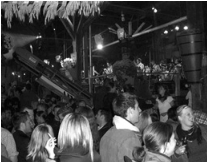
Stimmung pur in der herbstlich geschmückten Kelter