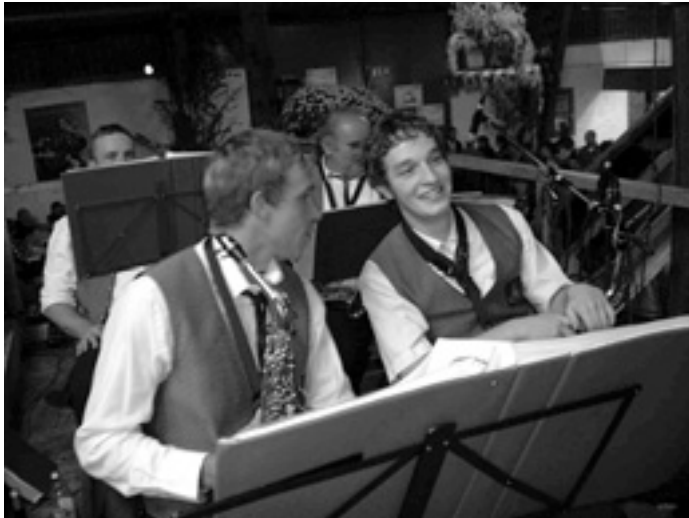
Kurze Verschnaufpause bei den Musikern