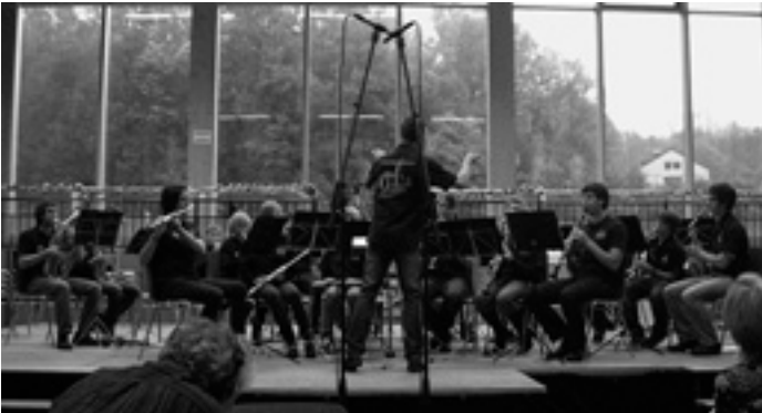
Die Jugendkapelle sehr motiviert beim ersten Musikstück

Am vergangenen Sonntag lag Musik in der Luft! Die Jugendkapellen der Musikvereine im Lautertalring trafen sich zum Jugendkonzert in der Kreuzberghalle in Nenningen und gaben mit ihrem Können ein abendfüllendes, musikalisch sehr abwechslungsreiches Programm zum Besten.