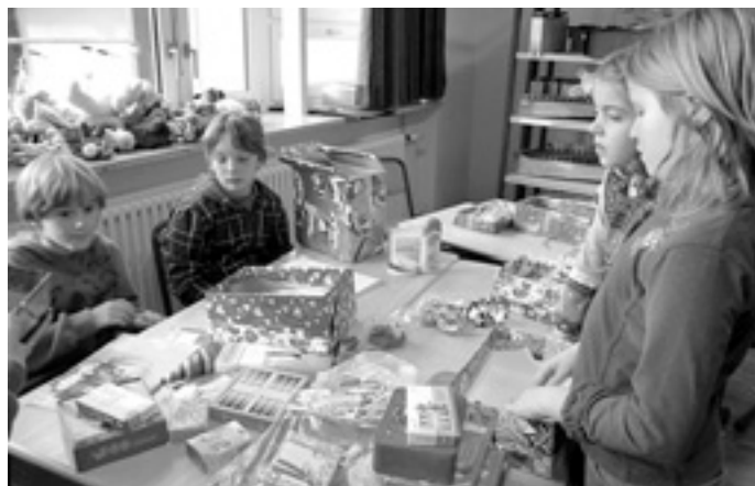
... Was könnte ein Kind noch brauchen?