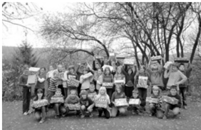
Wir hoffen, dass sich viele Kinder freuen