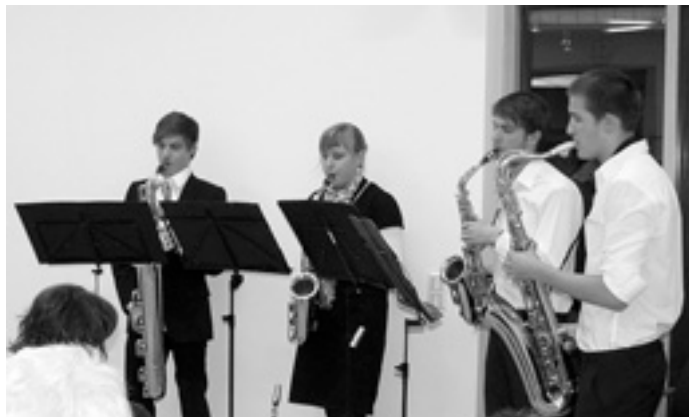
Sorgte für den guten Ton - das Saxofon-Quartett der Musikschule

Musikalisch wurde der Festakt vom Saxofon-Quartett der Musikschule Geislingen umrahmt, die Bewirtung beim anschließenden Empfang übernahmen in bewährter Weise die LandFrauen aus Steinenkirch.