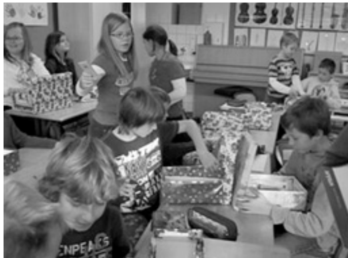
Verschenken und beschenken macht Spaß.