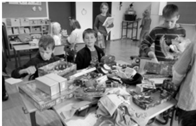
Wir packen für die »Buben« ...