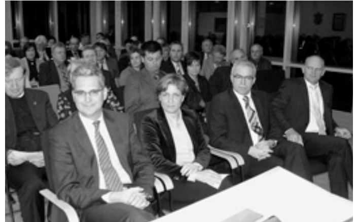
Zahlreiche Gäste wohnten dem Festakt bei