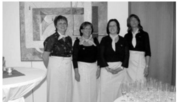
Sorgen für das leibliche Wohl - die LandFrauen Steinenkirch