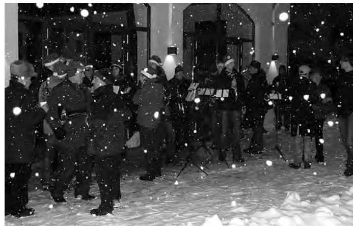
Weihnachtslieder im Kronenhof