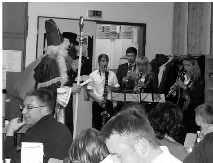
Das Klarinetten-Register begrüßt den Nikolaus mit einem Weihnachtslied.