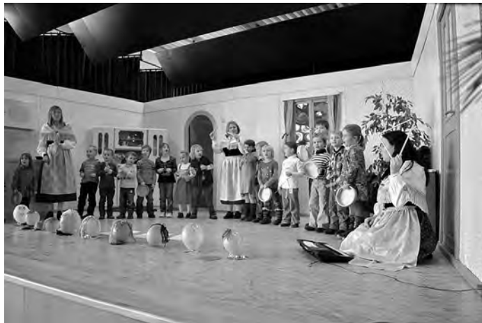
Für unseren Nachwuchs ist gesorgt - unsere 18 Musi-kids