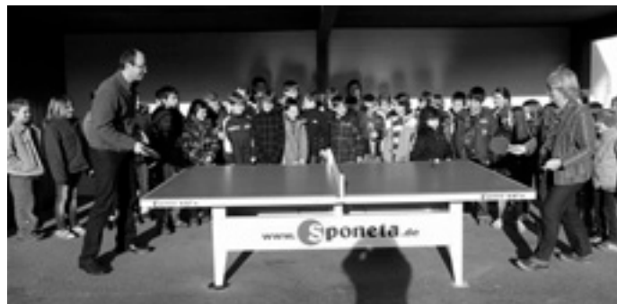
... ein spannendes Match ...