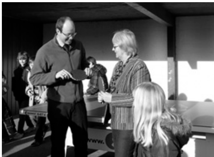
I glaub', des lag an meim Schläger!