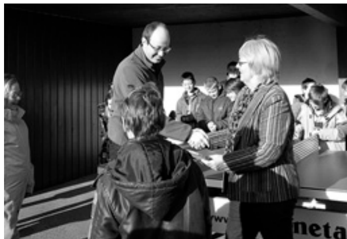
Gratulation an den Sieger