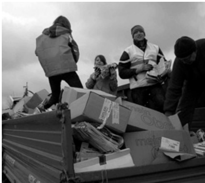
Voller Einsatz der Jungmusiker beim Abladen in den Container

Am Abend spielten wir bei der Veranstaltung der CDU Donzdorf-Lauterstein zur Landtagswahl am 27. 3. 2011 im Hotel Becher auf. Dort fand zum 1. Mal der Donzdorfer Stammtisch der Stammtische statt. Unter dem Motto: »Herr Minister: Der Stammtisch hat das Wort!« mit dem Innenminister des Landes Baden-Württemberg Heribert Rech MdL.