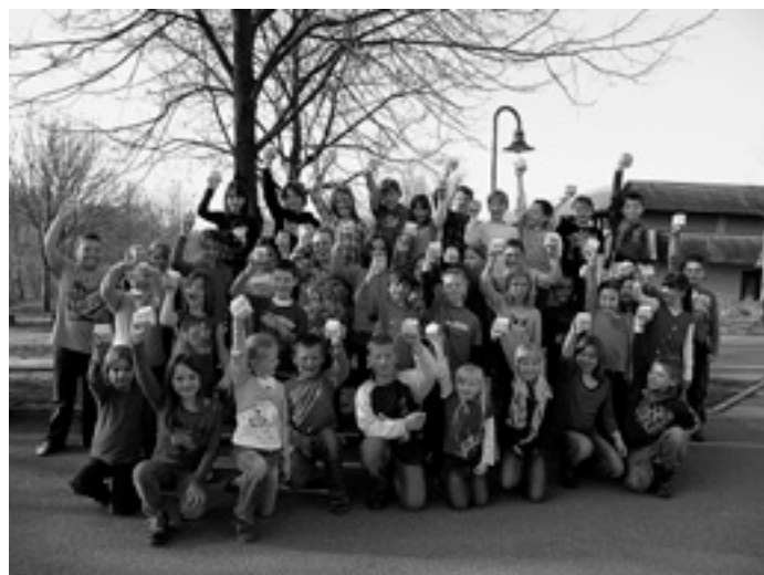
Die Milch macht uns wirklich munter