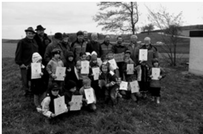
Alle großen und kleinen Helfer

Sie erfuhren, warum aufgeforstet werden soll und wie wichtig diese Hecken für kleine Tiere wie Hasen, Igel, aber auch Vögel und Insekten sind. Sie bilden einen Lebensraum für bestimmte Arten, ein Biotop. Danach ging es dann auch gleich an die Arbeit. Und die Kinder waren wirklich bei der Sache. Sie gruben zum Teil selbst die Löcher für die Bäume - wobei die meisten schon ausgehoben waren - und lernten, wie man die Stecklinge richtig einsetzt. Nebenbei wurden noch Regenwürmer beobachtet. Auch die vielen Erwachsenen hatten ihre Freude am Eifer der Kinder.