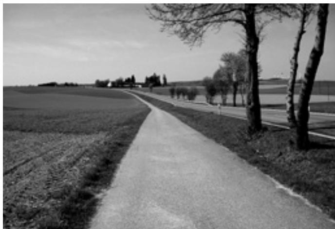
Dieser Feldweg darf nicht befahren werden, er muss dem Busverkehr und den Notfallfahrzeugen zur Verfügung stehen.

Die Umleitung des gesamten Verkehrs erfolgt über Söhnstetten und Gussenstadt.