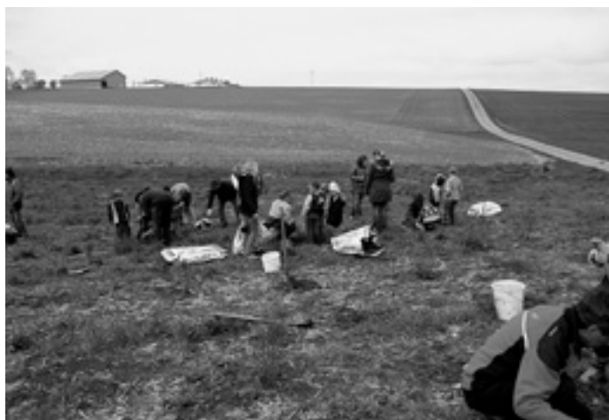
Bei der Arbeit