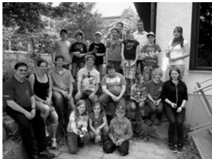
Die Gruppe nach erfolgreicher Schnitzeljagd rund um Böhmenkirch

Vergangenen Samstag fand das bereits angekündigte »Geo-Caching«- oder eine »moderne« Schnitzeljagd mit GPS-Geräten statt. Hierzu versammelten sich 20 begeisterte Jungmusiker am Proberaum und begaben sich nach einer kurzen Einführung, wie die GPS-Geräte zu bedienen sind, auf die Schatzsuche. Diese war so gestaltet, dass verschiedene Plätze rund um und in Böhmenkirch mit Hilfe der GPS-Geräte angelaufen wurden. An diesen verschiedenen Stationen waren jeweils kleine Döschen versteckt, die die Koordinaten der nächsten Station enthielten und ab und zu war auch noch eine kleine Wegzehrung in Form von Gummibärchen mit dabei. ;-) So ging es nun ca. 6 km im Laufschrift durch Wald und Flur, bis schließlich alle Gruppen wieder am Proberaum ankamen. Da eine solche Wanderung ganz schön hungrig macht, wurden dort noch leckere Steaks und Würstchen gegrillt und man ließ den Tag bei gemütlichem Beisammensein und einigen Spielen ausklingen. Vielen Dank an alle Teilnehmer und besonders an die Jugendleiter, die uns diesen tollen Tag möglich gemacht haben!