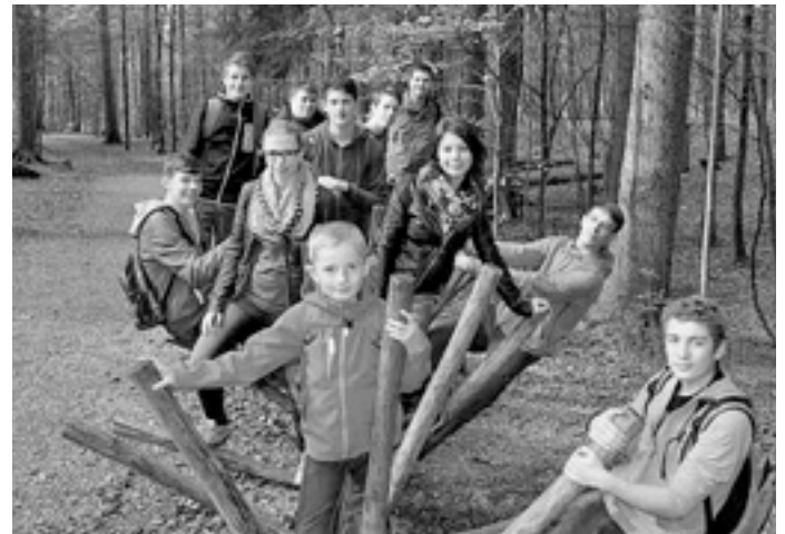
Gruppenfoto bei der Wanderung durch den Auwaldpfad

Ein weiteres Highlight war die Besichtigung von Schloss Neuschwanstein, hier durften wir viel Interessantes über das Schloss und seine Erbauung erfahren. Beim Sommerrodeln in Nesselwang kam die Action nicht zu kurz und alle hatten viel Spaß.