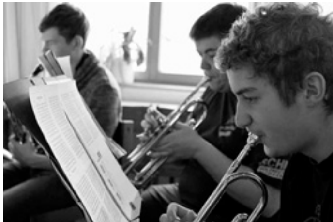
Noten lesen im Kleinformat

Natürlich haben wir während unseres Aufenthalts auch geprobt und neue Musikstücke eingeübt. Beim Theorieunterricht konnten nicht nur die kleineren etwas lernen.