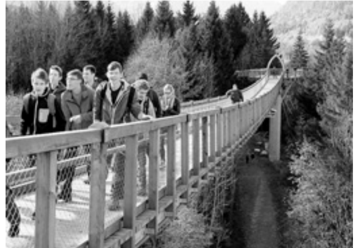
Besuch des Baumkronenwegs mit tollem Ausblick

Die folgenden Tage begannen wir mit dem Frühstück um 8:00 Uhr, danach hieß es entweder fertig machen zur Musikprobe oder Aufbruch zu einer unserer zahlreichen Unternehmungen. Hierzu zählte unter anderem der Besuch eines Baumkronenwegs, wo wir bei bestem Wetter auf Höhe der Baumwipfel die Landschaft genießen konnten.