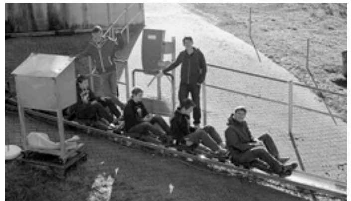
Kurz vor dem Start zur rasanten Abfahrt

Ein weiteres Highlight war die Besichtigung von Schloss Neuschwanstein, hier durften wir viel Interessantes über das Schloss und seine Erbauung erfahren. Beim Sommerrodeln in Nesselwang kam die Action nicht zu kurz und alle hatten viel Spaß.