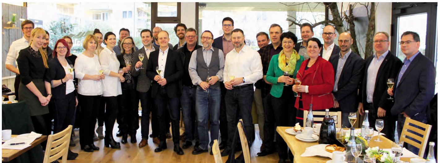
Foto: Mitglieder, Geschäftsstelle und Partner der Erlebnisregion Schwäbischer Albtrauf im Rahmen der Klausurtagung 2020 in Salach

In der anschließenden Klausurtagung sammeln die Mitglieder gemeinschaftliche Projektideen für den Tourismus im Kreis Göppingen. In den Mittelpunkt rückt die Themensäule »Natur« mit einzelnen Mikroabenteuern. Die Möglichkeiten vor der Haustüre sind vielfältiger als zuvor - vor allem am Albtrauf, wo die Natur noch ursprünglich ist.