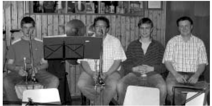
Ein vollzähliges Posaunen-Register - ? ☺