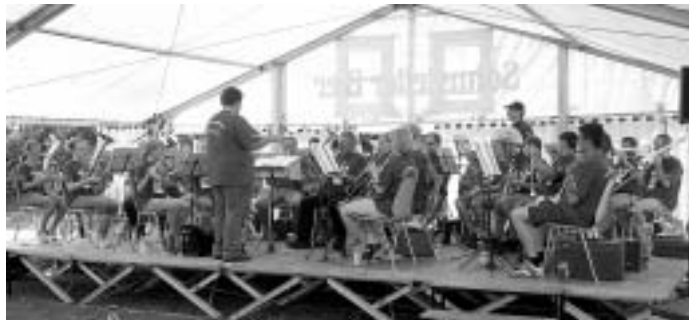
Original Schwäbische Trachtenkapelle Treffelhausen, bei der Hitze et- was legerer.

Nach dem Kräfteressen spielte die Original Schwäbische Trachtenkapelle Treffelhausen und am Abend der Musikverein Süßen.