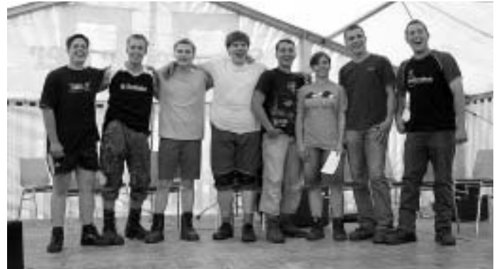
Böhmenkircher Soilwend, die glücklichen Gewinner bei der Siegerehrung.