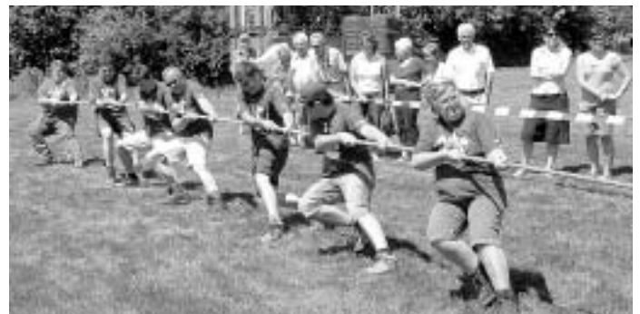
Auch die Mannschaft aus Treffelhausen holte aus ihren Muskeln die letzten Kraftreserven.