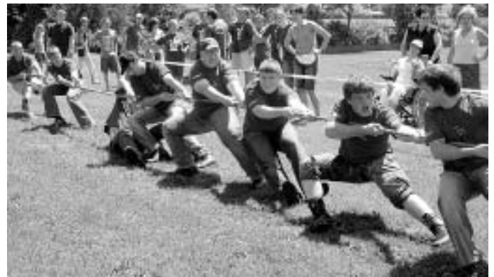
Die Mannschaft des Musikvereins Böhmenkirch kämpfte bis zum Umfallen