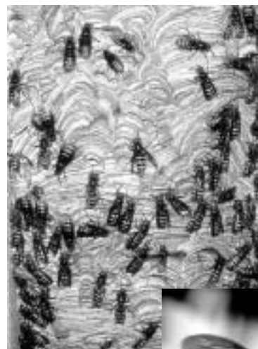
Kunst am Bau - Hornissen bei der Arbeit

Für weitere Fragen steht Ihnen Ihr Landratsamt gerne zur Verfügung (Tel. 07161 / 202-417; umweltschutzamt@landkreis-goepplingen.de ). Dort erhalten Sie auch ein informatives Faltblatt zum Thema, welches auch im Internet zum Download bereitsteht ( www.landkreis-goepplingen.de ).