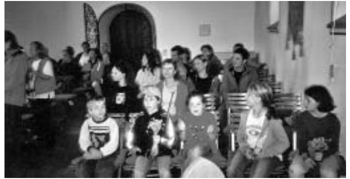
In der Patriz-Kapelle

Die Patriz-Kapelle besuchten die Kinder und ihre Eltern während der Familienwanderung. Pfarrer Kenner erzählte ein wenig aus dem Leben des Heiligen Patrick und die Kinder sangen zwei Lieder dazu.