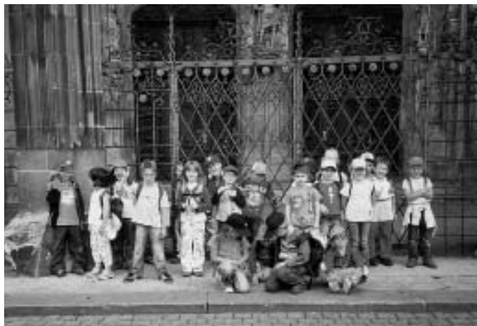
Vor dem Ulmer Münster