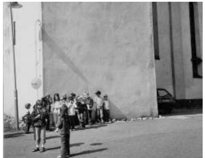
Vor dem Kirchturm

Begonnen wurde mit dem Vermessen der Kirche. Mit Hilfe eines Wollfadens haben die Kinder den Umfang des Gebäudes ermittelt. Dieser beträgt ungefähr 150 Meter. Danach wurde die Höhe des Kirchenschiffs gemessen. Das gelang mit einem gasgefüllten Luftballon, der an einer Schnur hing. 10 Meter wurden als Höhe ermittelt. Beim Vermessen des Kirchturmes streifte der Ballon allerdings, es war schon zuviel Gas entwichen. Ein Blick ins Internet genügte aber um festzustellen, dass der Turm 50 Meter hoch ist.