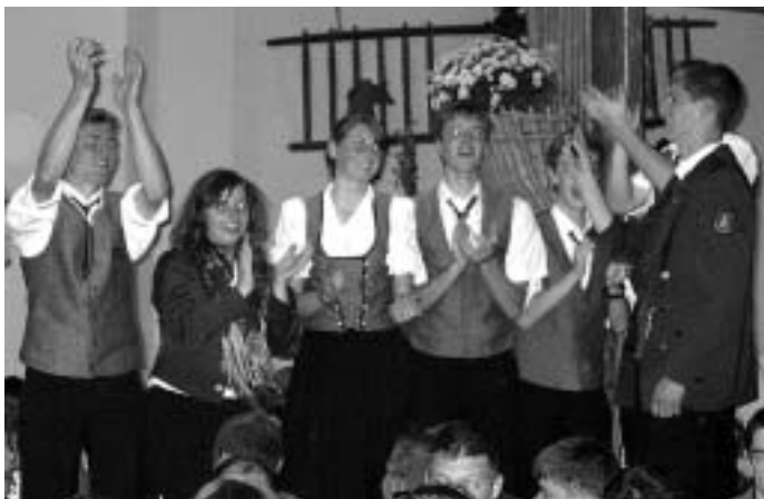
Auch die Jugend wurde von der Stimmung mitgerissen.

Ein Gegenbesuch des Strümpfelbacher Musikvereins wurde schon arrangiert.