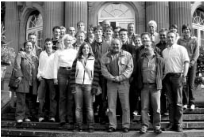
Der Musikverein vor dem Staatsministerium

Nach der Verabschiedung in der Villa Reitzenstein machten wir noch einen kurzen Rundgang durch die prächtige Gartenanlage. Wertvolle Bäume und künstliche Teiche zieren den eindrucksvollen Park.