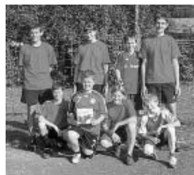
Die Siegermannschaft »Saustall«

Außerdem hat die Mannschaft »Bienhäusle« am Turnier teilgenommen.