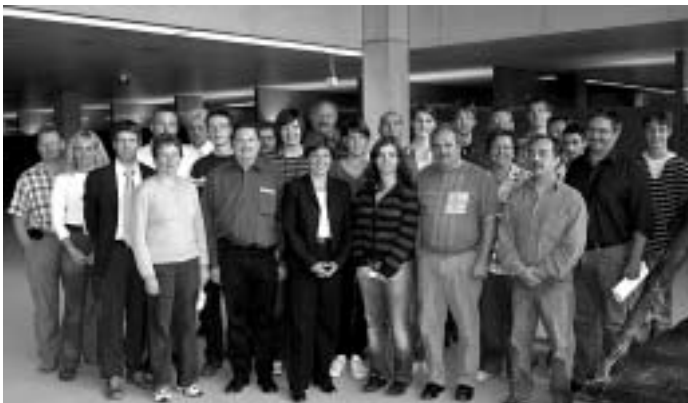
Nicole Razavi mit dem Musikverein im Landtag

Um 15:00 Uhr wurden wir von einem Mitarbeiter des Besucherdienstes in einem Besprechungsraum im Landtag von Baden-Württemberg begrüßt. Er erklärte uns kurz die Arbeit des Landtags: Wie werden die Gesetzesänderungen vorbereitet, wie verläuft die Gesetzgebung usw. Dann ging es zur Plenarsitzung.