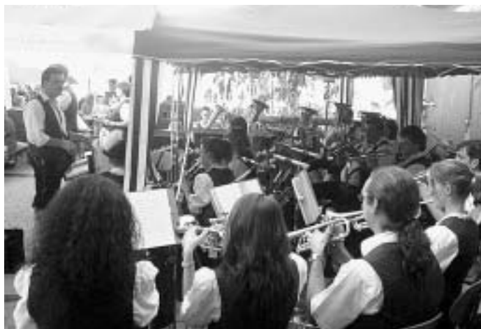
Schwäbische Trachtenkapelle Söhnstetten (einmal unter »fremder« Leitung.):