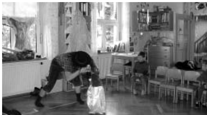
Kampf gegen den Riesen

Eine Reise durch das Märchenland unternahmen die Kinder des Katholischen Kindergartens am vergangenen Freitag. Viele Hexen, Prinzessinnen, Königssöhne, Rotkäppchen und andere Märchengestalten machten sich auf, fünf Aufgaben zu erfüllen. Am Ende der Reise wartete der Königsthron, den die Helden dann besteigen durften. Worin bestanden die Aufgaben? Es galt gegen einen Riesen zu kämpfen, die goldene Kugel der Königstochter aus dem Brunnen zu holen und im Garten der Zauberin verschiedene Gerüche zu erkennen. Am Tisch der Sieben Zwerge sollten die Kinder erraten, von welchen Tellerlein Schneewittchen gegessen hat und der richtige Farbzweig musste auch noch gefunden werden.