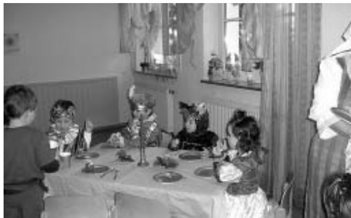
Essen im Dornröschenschloss

Zur Stärkung zwischendurch gab es ein Festessen im Dornröschenschloss. Die fleißigen Köchinnen hatten ein buntes Büfett zusammengestellt und die Märchenlandreisenden durften von goldenen Tellern essen. Glücklicherweise waren genügend davon da, so dass keine Fee böse werden musste.