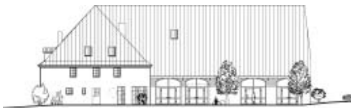
Nordseite - Variante 2

Auch das Konzept für die Einrichtung der Bücherei , welches gemeinsam mit der Fachstelle für das Büchereiwesen erarbeitet wurde, hat der Gemeinderat einstimmig gebilligt. Dieses Konzept geht davon aus, dass die neue Bücherei mit einem Anfangsbestand von 3.000 Medien startet, und innerhalb von drei bis fünf Jahren auf 6.000 Medien ausgebaut wird. Die Bücherei soll als Familienbibliothek und kommunaler Treffpunkt ausgerichtet sein. Zielgruppen sind dabei junge Familien, Kinder bis 12 Jahre, Senioren und rutschende Laien. Für die Beschaffung der Medien wird mit Kosten von rund 47.000 Euro gerechnet. Derzeit wird geprüft, welche Bücher aus der katholischen Bücherei und der Schulbibliothek übernommen werden können.