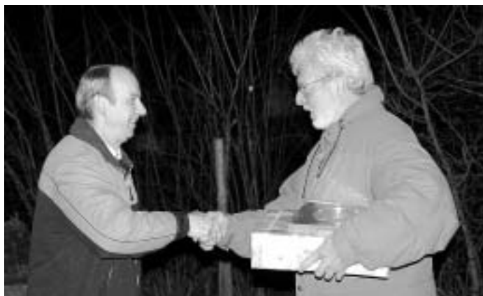
Gratulation durch unseren Vorstand