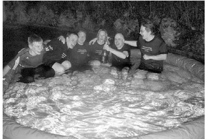
Versprechen eingelöst: »Wenn wir aufsteigen, baden wir im Pool!«