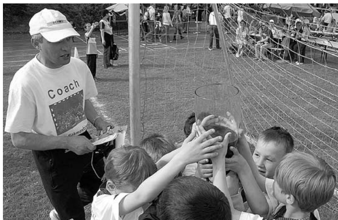
Das tolle Ergebnis wurde gebührend gefeiert.

Sie belegten einen hervorragenden 3. Platz in der Bundesliga-Gruppe.