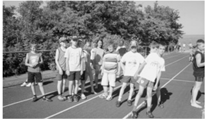
Leider sind das unsere letzten Bu-Ju-Spiele in Treffelhausen