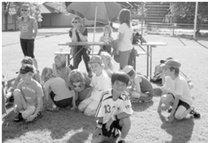
Wir stehen noch zum Weitwurf an