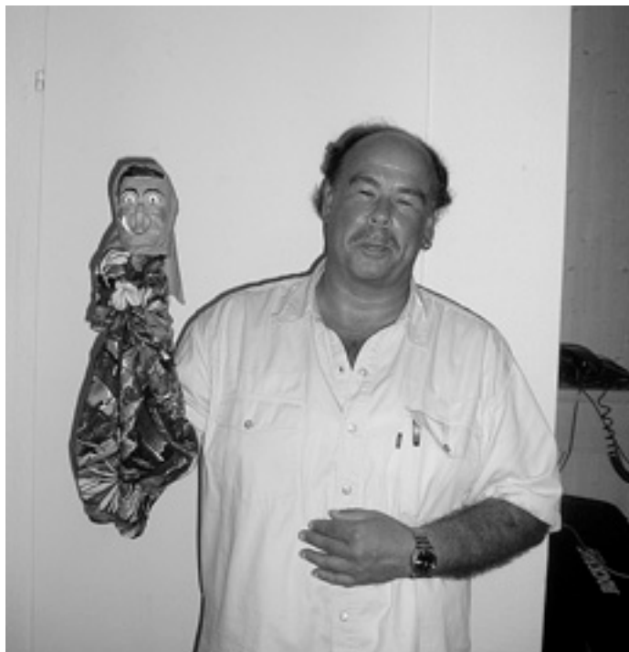
Der Referent mit Handpuppe Trude Hinkebein