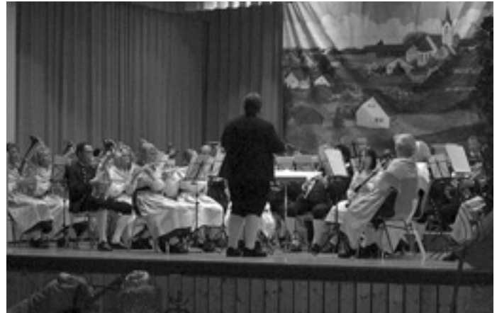
Original schwäbische Trachtenkapelle