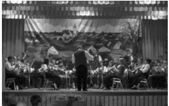
Musikverein »Eintracht« Schnittlingen

die Musiker gemeinsam mit »Robin Hood - König der Diebe« auf der Seite der Armen und Unterdrückten gegen die Willkürherrschaft des Sheriffs von Nottingham. Mit der Polka »Daheim in Böhmen« von Ferek Mestrini und dem Marsch »Auf Adlers Schwingen« beendete die Trachtenkapelle ihren Vortrag und entließ das Publikum nach einem stürmischen Beifall in die Pause.