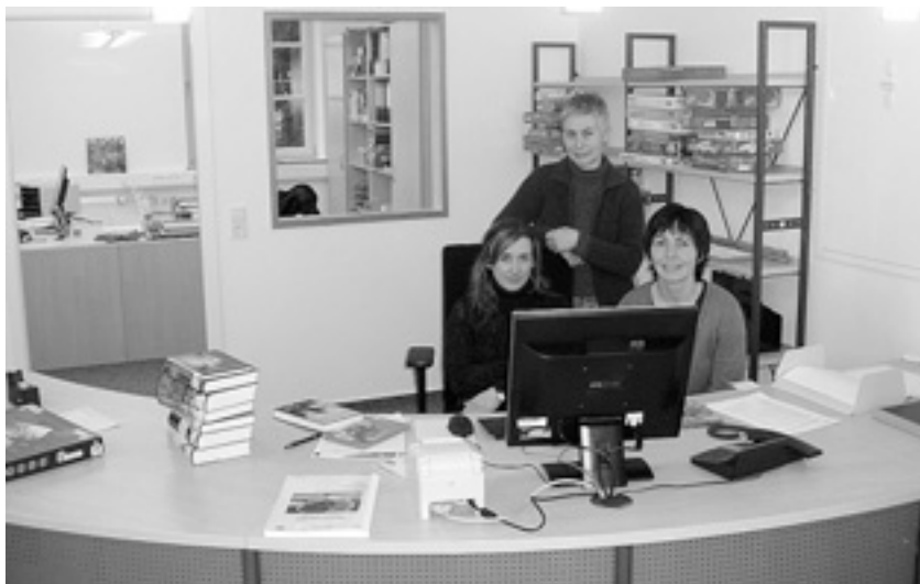
Ihr Bibliotheksteam stellt sich vor (von links):

Die meisten Handwerksarbeiten sind fertig gestellt, so geht es nun ans Einräumen der neuen Medien. Wir wollen mit insgesamt ca. 5.000 Medien an den Start gehen. Das bedeutet jetzt für uns, 3.500 neue Medien, die nach und nach angeliefert werden, einzuarbeiten und einzuräumen. Dies wird in den folgenden Wochen vollends geschehen. Im Rahmen des Weihnachtsmarktes am 07.12.2008 bieten wir Ihnen nun die Möglichkeit, in die Räumlichkeiten der neuen Bibliothek hinein zu schnuppern und sich mit unserem neuen, erweiterten Angebot vertraut zu machen.