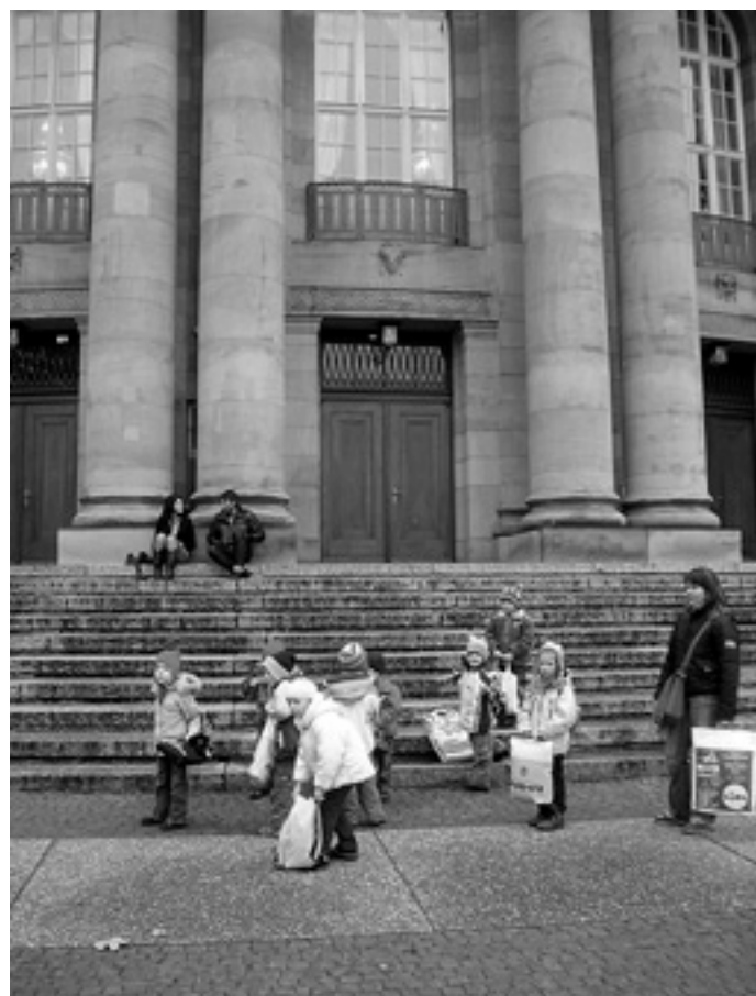
Die Vorschüler auf den Stufen der Staatsoper