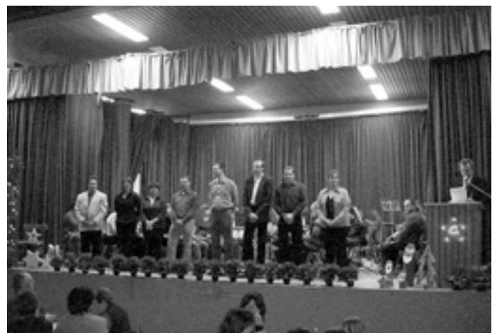
Ehrung 20 Jahre MV Schnittlingen