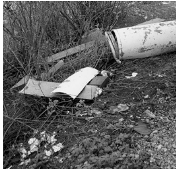
Blick neben die Zuschauertribüne

Mit einer beachtlichen Leistung konnten irgendwelche Vandalen in den vergangenen Wochen wieder aufwarten. Nicht nur, dass der Mülleimer und die Sitzbank in die Hecken geworfen wurden - nein die Bank wurde zuvor auseinandergebrochen und der Mülleimer wurde zuvor zerstört.