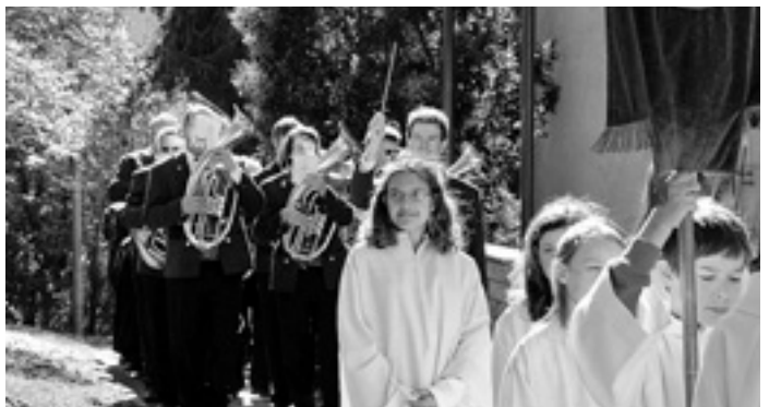
Der Musikverein vom Jugendheim zur Kirche.

Feierlich begleitete der Musikverein die Erstkommunionkinder vom Jugendheim zur Kirche. Anschließend wurde der Gottesdienst musikalisch umrahmt und zum Abschluss gab es bei schönem Wetter vor der St. Hippolyt Kirche ein Ständchen.