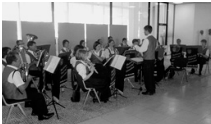
Der Musikverein im Landtag

Am vergangenen Samstag fand im Landtag von Baden-Württemberg der diesjährige Bürgertag der CDU-Landtagsfraktion statt. Es wurde die Funktionsweise des Landesparlaments und die Arbeit der CDU-Fraktion vorgestellt. Dazu gab es verschiedene Diskussionsrunden, unter anderem mit Ministerpräsident Günther Oettinger. Zu diesem Anlass spielte der Musikverein Böhmenkirch zum Frühschoppen von 10.00 - 11.00 Uhr im Foyer des Landtages.