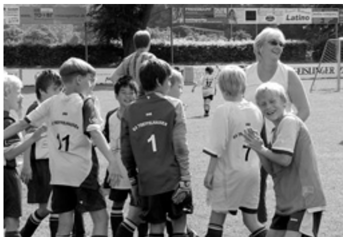
Die letzten taktischen Anweisungen ...