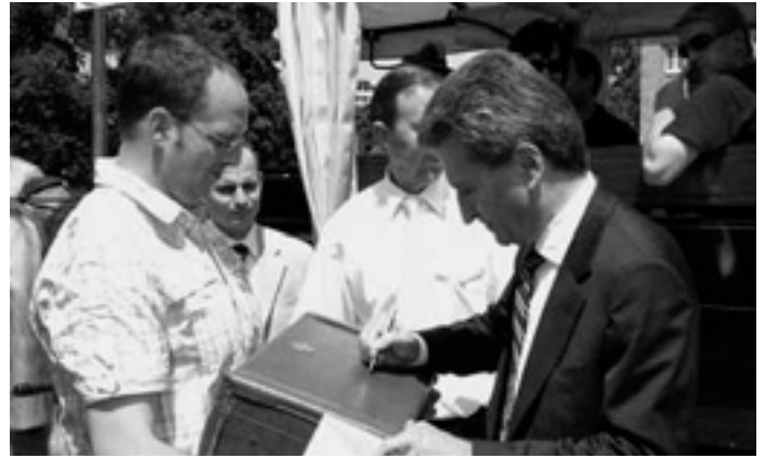
Günther Oettinger signiert den Instrumentenkoffer