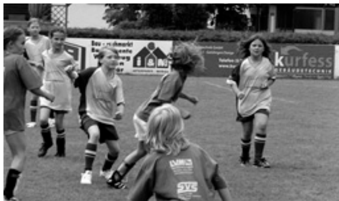
Die Mädchen im Angriff