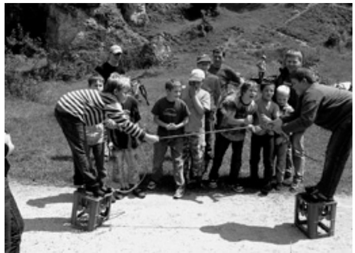
Tauziehen einmal anders!

Rast am Leispielspielplatz allen willkommen war. Als dort dann noch der »Bonbonman« auftauchte, war von Ermüdungserscheinungen nichts mehr zu merken. Alle Jungs machten sich auf die Jagd, um möglichst viele Bonbons zu ergattern. Zufrieden kamen wir um 17 Uhr am Sportplatz an, wo sich die Böhmenkircher von den Steinenkircher verabschiedeten. Wir hoffen, ihr seid alle wieder dabei, wenn es erneut heißen wird: Boys only!