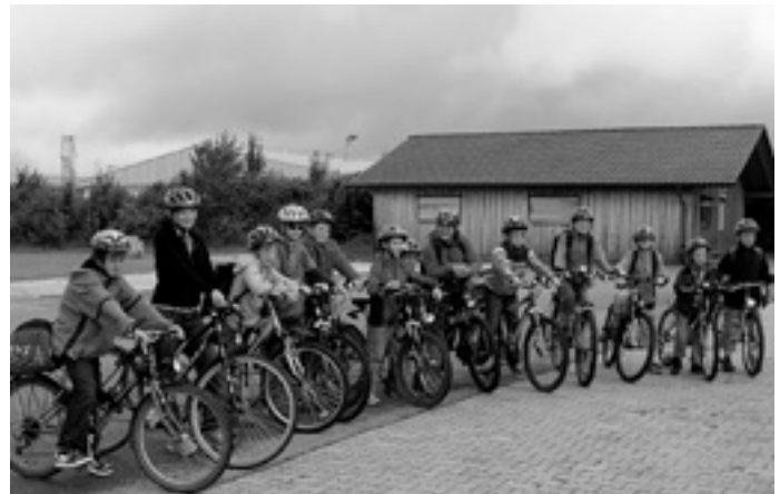
Vor der Abfahrt: Hält das Wetter???

»Felsenfest und stark« war unser Tagesmotto. Nicht nur naturnah im Felsenmeer, sondern auch unsere kurze Andacht beinhaltete dies, denn hier erfuhren wir: Felsenfest und stark ist unser Gott. Die Stärke der Jungs kam dann danach bei verschiedenen Spielen zum Einsatz. Egal ob beim Tauziehen auf Getränkeboxen oder beim Dreibeinfußball. - Wir hatten viel Spaß miteinander. Viel zu schnell gingen die Stunden im Felsenmeer vorbei und wir mussten uns an den Heimweg machen. Bei Gegenwind ging es auf der Heimfahrt nochmal richtig an die Kondition, so dass eine letzte