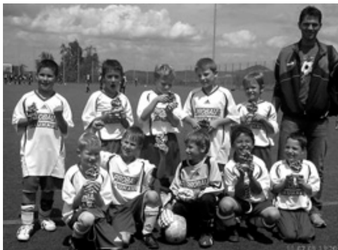
Die Freude war natürlich riesengroß

Nach einem eher verhaltenen Start (2 Spiele, 1 Punkt) legten wir ab dem 3. Spiel so richtig los. Wir ließen uns dabei auch nicht von falschen Ergebnisdurchsagen sowie nicht ganz nachvollziehbaren Schiedsrichterentscheidungen aus der Ruhe bringen. Durch gelungene Kombinationen und schöne Tore gewannen wir die nächsten Spiele mit 1:0, 2:0 und 8:0 und zeigten unseren Gegnern »wo der Bartl den Moscht holt«. Nach 5 Spielen hatten wir 10 Punkte, 13:3 Tore und den Turniersieg unter Dach und Fach.